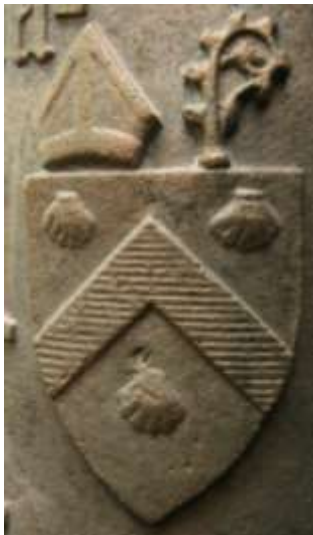
Wapenschild op Suzannaklok