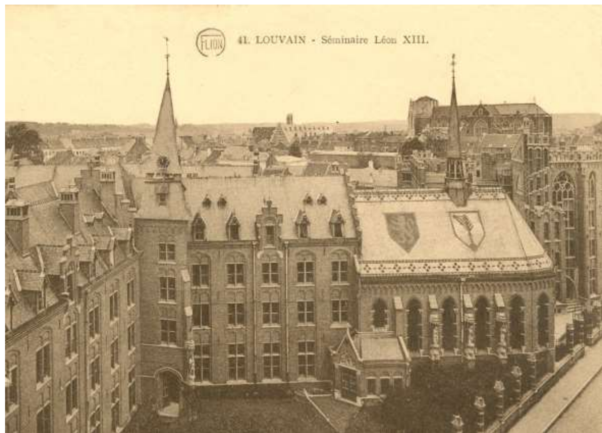
Postkaart Leo XIII seminarie anno 1926