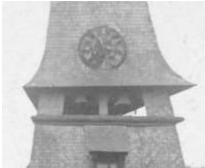
Detail toren traphal uit foto postkaart anno 1910