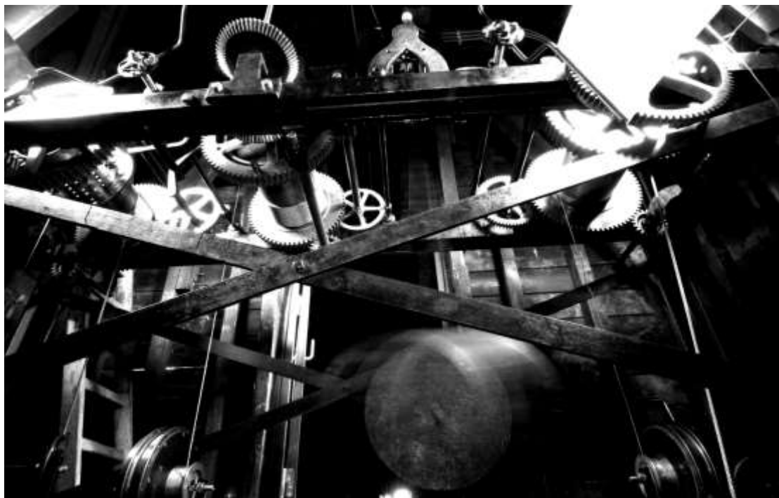
Samen met de buitenrenovatie van het seminarie 2015-2016 werd ook het oorspronkelijk torenuurwerk terug in werking gesteld.

Vooraleer we verder gaan met de uitleg van de klokjes, dienen we een blik te werpen op het historische mechanisch uurwerk dat sinds de renovatie van het seminariegebouw in 2015-2016, door de firma Clock-o-matic mee werd gerenoveerd. Wel is het zo dat het torenuurwerk vrij massieve proporties heeft; om het terug op zijn oorspronkelijke plaats te zetten moesten enkele dwarsbalken in het toren boven de traphal verwijderd worden. Sinds de renovatie hangen de drie gewichten (gaande werk, slagwerk en speelwerk) wel mooi terug op hun plaats in de grote, monumentale traphal waar vanaf het begin speciaal ruimte was uitgespaard.