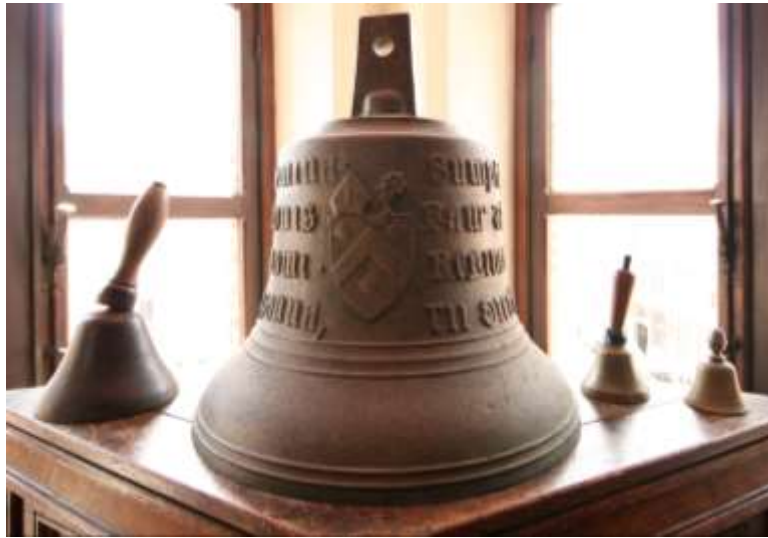
De Suzannaklok

naam Suzanna. Zo kon de informatie omtrent de reeks van voorslagklokjes vervolledigd worden. Suzanna bleek de kleinste klok in de reeks te zijn (de laterale hoogte is 23 cm; de diameter is 32 cm; gewicht is 19 kg). De toonhoogte van Suzanna is re (d 3 ).