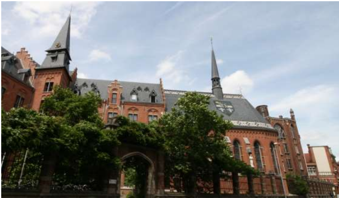
Het seminariegebouw met links de toren boven de traphal waar de vijf voorslagklokken hingen en rechts het kapeltoren met de luiklok Adela.

De rector was van bij het begin een koele minnaar van dit recent opgerichte pauselijk instituut aan zijn universiteit en het succes van de filosofieprofessor Mercier was hem een doorn in het oog. Alle middelen werden ingezet om Mercier zwart te maken. 2 In bovenstaande correspondentie aan Kardinaal Goossens betreft het dus in zijn ogen overdreven monumentaliteit van de gebouwen.